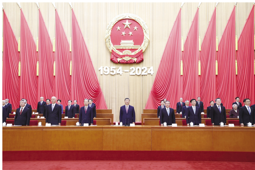
■9月14日上午,中共中央、全国人大常委会在北京人民大会堂隆重举行庆祝全国人民代表大会成立70周年大会。习近平、李强、赵乐际、王沪宁、蔡奇、丁薛祥、李希、韩正等出席大会。

新华社北京9月14日电 中共中央、全国人大常委会14日上午在人民大会堂隆重举行庆祝全国人民代表大会成立70周年大会。中共中央总书记、国家主席、中央军委主席习近平出席会议并发表重要讲话。他强调,要进一步坚定道路自信、理论自信、制度自信、文化自信,发展全过程人民民主,坚持好、完善好、运行好人民代表大会制度,为实现新时代新征程党和人民的奋斗目标提供坚实制度保障。